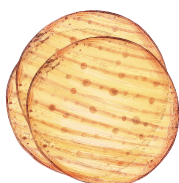
Matzot Panes sin levadura